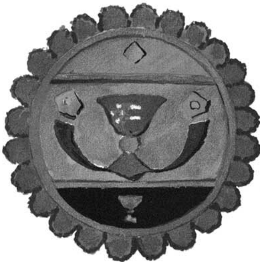
Armoirie du tableau de Bellini (grandeur naturelle).