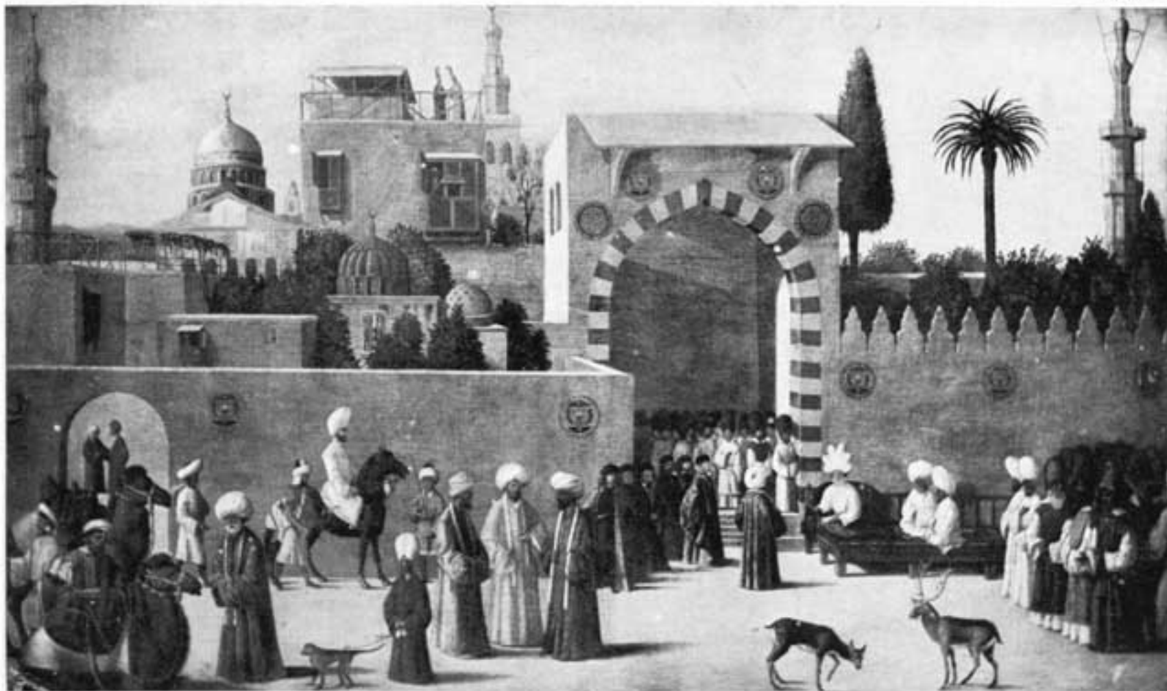
BELLINI. — Réception d'un ambassadeur vénitien par le Sultan Kansu el Ghoury, en 1512.